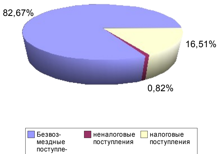
Структура доходов бюджета Кукшумского поселения в 2006 году

Налоговых и неналоговых доходов собрано в бюджет поселения в сумме 225877,81 руб. или 104,32 % к годовым назначениям.