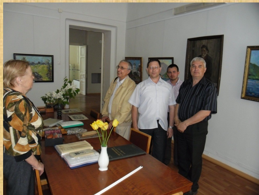
Педагоги Чувашского республиканского института образования