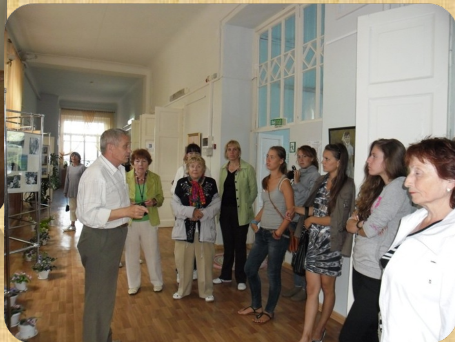
Туристы с теплохода «Василий Чапаев»